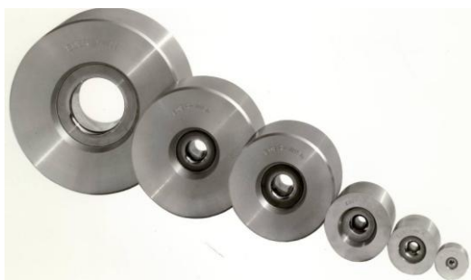
Apresentação: Linha de Versão Básica

Linha de Equipamentos para Fieiras em Metal Duro Possibilidades para equipar uma Oficina básica para Fieiras