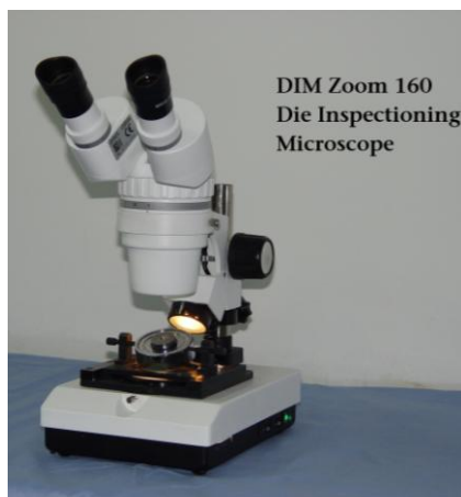
DIM Zoom 160 Die Inspectioning Microscope